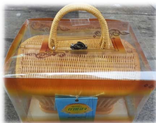
ผลิภัณฑ์เขี่ยนหมาก