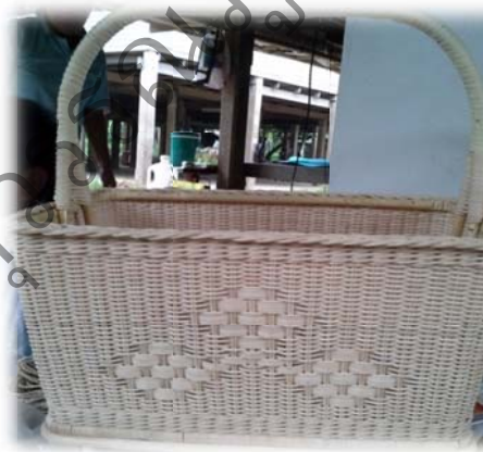
ตะกร้าเขียนหมาก พร้อมบรรจุภัณฑ์ที่ได้รับการพัฒนา