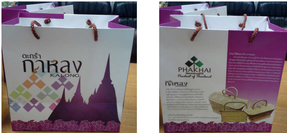
ประชาสัมพันธ์กลุ่มจักสานตะกร้าหวาย อำเภอผักไห่ จังหวัดพระนครศรีอยุธยา