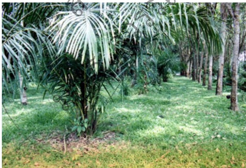
ต้นหวาย ( Calamus caesioides Blume.)

หวายเป็นพืชเศรษฐกิจที่สำคัญชนิดหนึ่งของประเทศในเขตร้อน โดยเฉพาะประเทศไทย ในจังหวัดสกลนครและขอนแก่น มีการปลูกหวายเชิงการค้า นิยมนำส่วนลำต้นที่สูงและมีความยืดหยุ่นมากเป็นพิเศษมาสานเป็นเฟอร์นิเจอร์ ลูกหวายอ่อนใช้กินเป็นผักจิ้มน้ำพริก แกะเปลือกออกแล้วนำไปทำส้มตำ หน่อหวายใช้ทำอาหาร เช่น แกงอ่อม ซุบหน่อหวาย ยำ ข้าวเกรียบ และหวายทอดกรอบ หวายบางชนิดในผลมีเรซินสีแดงเรียกเลือดมังกร ซึ่งใช้เป็นยาในสมัยโบราณและใช้ย้อมสีไวโอลิน ในรัฐอัสสัม ประเทศอินเดีย ใช้หน่อหวายเป็นอาหารเช่นกัน