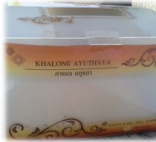
รูปแบบบรรจุภัณฑ์