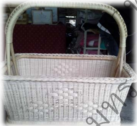
ตะกร้าหวาย “ลายผักไห่”