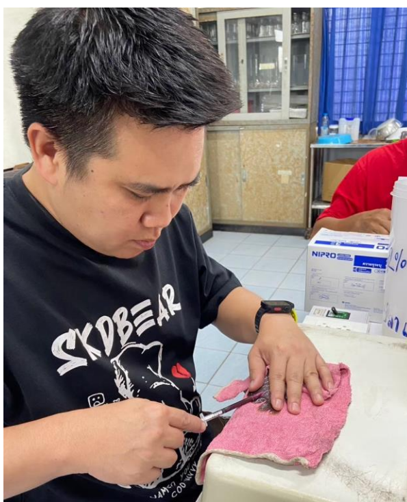
Figure 6 Sampling of fish blood.

หลังจากการเลี้ยงปลาในกระชังเป็นระยะเวลา 60 วัน งดให้อาหารปลาเป็นเวลา 24 ชั่วโมง จากนั้นสุ่มปลาชุดการทดลองละ 9 ตัว ทำการสลบปลาโดยใช้น้ำมันกานพลูความเข้มข้น 40 ppm เจาะเลือดปลาจากเส้นเลือดส่วนหาง (puncturing the caudal peduncle) โดยใช้เข็มและกระบอกฉีดยาขนาด 1 ml ที่ปราศจากเชื้อ แบ่งเลือดออกเป็นสองส่วน ส่วนแรกนำไปใส่ยังหลอดเก็บเลือด BD vacutainer blood collection tubes เพื่อศึกษาค่าโลหิตวิทยา (Figure 6) อีกส่วนหนึ่งนำมาปั่นเหวี่ยงที่ความเร็ว 12,000 rpm 5 นาที 4 °C และเก็บตัวอย่างซีรัมไว้ที่อุณหภูมิ -20 °C จนกว่าจะใช้ในการทดสอบทางชีวเคมีและภูมิคุ้มกัน ตามวิธีของ Wangkaharta et al. (2022)