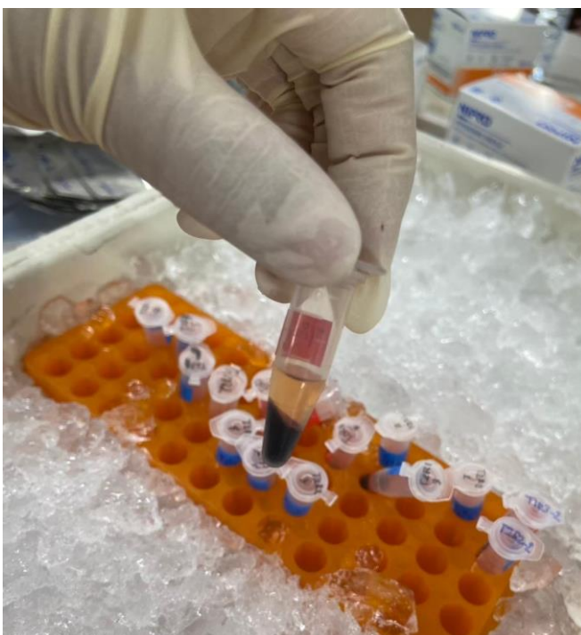
Figure 7 Serum from fish.