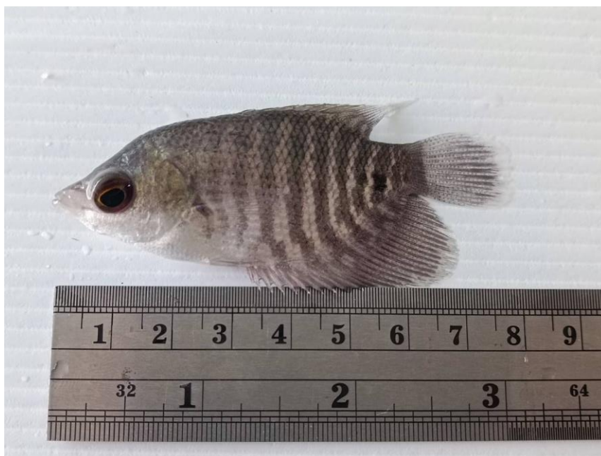
Figure 1 Giant gourami ( Osphronemus goramy ) characteristics

ปลาแรดมีความสำคัญทางเศรษฐกิจที่สร้างรายได้ให้กับประเทศไทย และยังเป็นสัตว์น้ำจืดเศรษฐกิจที่กรมประมงมีแผนในการขับเคลื่อนตามแผนปฏิบัติการพัฒนาสัตว์น้ำจืดที่มีความสำคัญทางเศรษฐกิจ พ.ศ. 2565 - 2570 เพื่อมุ่งยกระดับความสามารถพัฒนาศักยภาพการผลิตสัตว์น้ำและธุรกิจเกี่ยวข้อตลอดห่วงโซ่คุณค่า เพื่อให้สินค้าสัตว์น้ำจืดของไทยสามารถแข่งขันในตลาดได้อย่างมีประสิทธิภาพ สร้างความมั่นคงด้านอาชีพการเพาะเลี้ยงสัตว์น้ำให้เกษตรกร รวมถึงพัฒนาการผลิตสัตว์น้ำจืดที่มีความสำคัญทางเศรษฐกิจได้อย่างยั่งยืน (กรมประมง, 2566 ข) ปลาแรดสามารถเลี้ยงเป็นปลาเนื้อและปลาสวยงามได้ ทำให้เป็นที่ต้องการของตลาดและเป็นสัตว์น้ำที่มีราคาจำหน่ายค่อนข้างสูง จากสถิติกรมประมง พ.ศ 2566 ผลผลิตปลาแรดที่ได้จากการเพาะเลี้ยงมีจำนวน 736 ตัน มีมูลค่ามากกว่า 53 ล้านบาท โดยเป็นการเลี้ยงปลาในบ่อมากที่สุด รองลงมาเป็นการเลี้ยงในร่องสวนและกระชังตามลำดับ พื้นที่ส่วนใหญ่นิยมเลี้ยงในภาคเหนือ มีผลผลิตมากกว่า 470 ตัน (สถิติกรมประมง, 2566) การเพาะเลี้ยงปลาแรดประสบปัญหาการขาดแคลนลูกพันธุ์ มีการเพาะขยายพันธุ์ได้จำนวนน้อยไม่เพียงพอต่อความต้องการของตลาด รวมทั้งปัญหาด้านอัตราการเจริญเติบโตที่ช้าทำให้การเลี้ยงปลาใช้ระยะเวลานานเพื่อให้ได้ขนาดที่ตลาดต้องการจึงเป็นข้อจำกัดในการเลี้ยงปลาแรด (กรมประมง, 2566 ก)