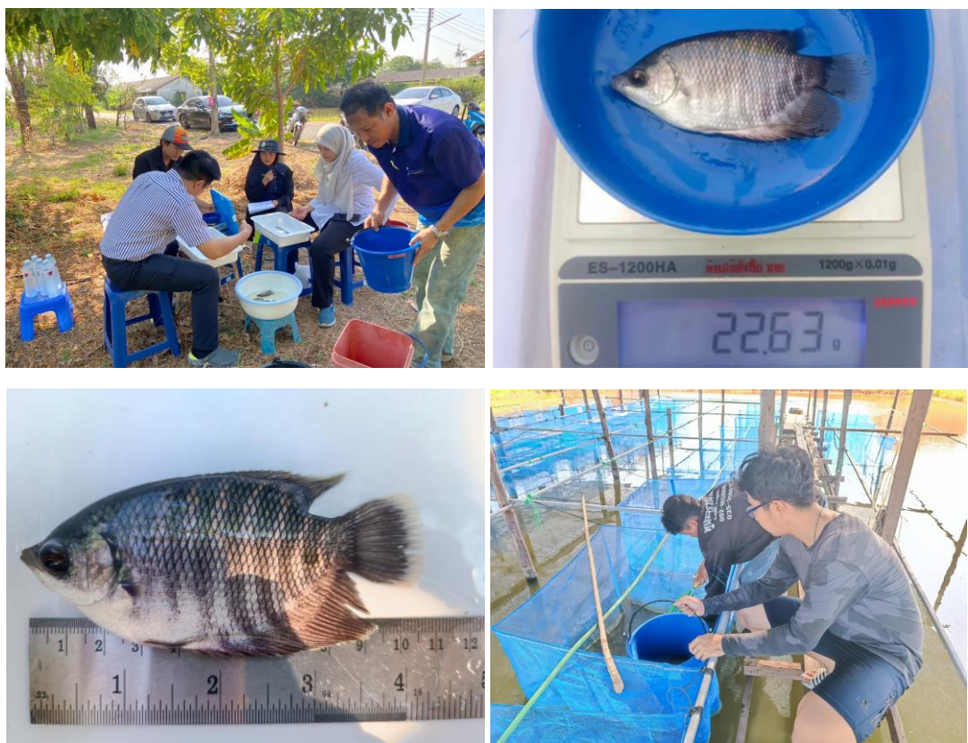
Figure 5 Growth and survival of Giant gourami examination