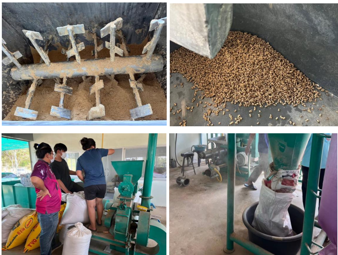
Figure 3 Preparation of experimental feed

ผลิตอาหารที่มีปริมาณโปรตีน 30 เปอร์เซ็นต์ และ Schizochytrium sp. (SZT) โดยนำวัตถุดิบที่กำหนดไว้ใน Figure 3 และ Table 1 ของแต่ละชุดการทดลอง ผสมให้เข้ากันโดยใช้เครื่องผสมอาหาร ทำการอัดเม็ดอาหารด้วยเครื่องบดเนื้อ โดยอัดผ่านหน้าแว่นอาหารที่มีเส้นผ่านศูนย์กลาง 3 มิลลิเมตร ส่วนผสมที่ได้จะถูกทำให้แห้งที่อุณหภูมิ 45 °C เป็นเวลา 72 ชั่วโมงในเตาอบลมร้อน จากนั้นนำมาบดเป็นผงสำหรับการอนุบาลลูกปลา วิเคราะห์หาคุณค่าทางโภชนาการของอาหารโดยใช้วิธี AOAC (2000) และเก็บไว้ที่ 4 °C จนกว่าจะนำไปใช้ (Phinyo et.al , 2024)