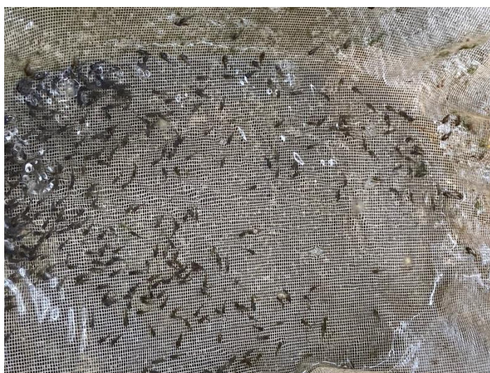
Figure 2 Giant Gourami fingerlings

ปรับสภาพลูกปลาแรดอายุ 7 วัน (หลังจากถูกไข่แดงยุบ) จำนวน 3,750 ตัว ที่ได้จากฟาร์มเอกชนในจังหวัดนครปฐม (Figure 2) ณ สาขาวิชาวิทยาศาสตร์การประมง คณะเทคโนโลยีการเกษตร และอุตสาหกรรมเกษตร มหาวิทยาลัยเทคโนโลยีราชมงคลสุวรรณภูมิ ศูนย์หันตรา ในตู้กระจกขนาด 30x60x45 เซนติเมตร จำนวน 15 ตู้ ปล่อยปลาที่ความหนาแน่น 250 ตัว/ตู้ (5 ตัว/น้ำ 1 ลิตร) (Amriawati et al. , 2021) โดยเติมน้ำประปาที่ผ่านการพักไว้ 7 วันจนไม่มีคลอรีนให้ได้ปริมาตร 50 ลิตร/ตู้ และปรับคุณภาพน้ำให้เหมาะสมต่อการเลี้ยงสัตว์น้ำ คือ อุณหภูมิของน้ำอยู่ระหว่าง 25-32 องศาเซลเซียส ค่าความเป็นกรดต่างอยู่ระหว่าง 6.5-8.5 และค่าออกซิเจนละลายในน้ำมากกว่า 5 มิลลิกรัม/ลิตร ให้อาหาร 5 % ของน้ำหนักตัว/วัน วันละ 3 ครั้ง (8.00, 12.00 และ 17.00 น.) (ยุพินท์ และรัชนีบูลย์, 2557)