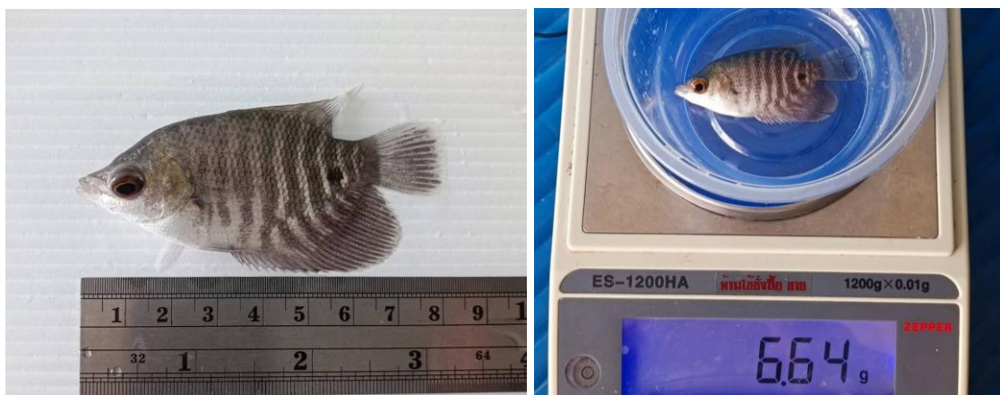
Figure 4 Giant gourami utilized in the investigation.